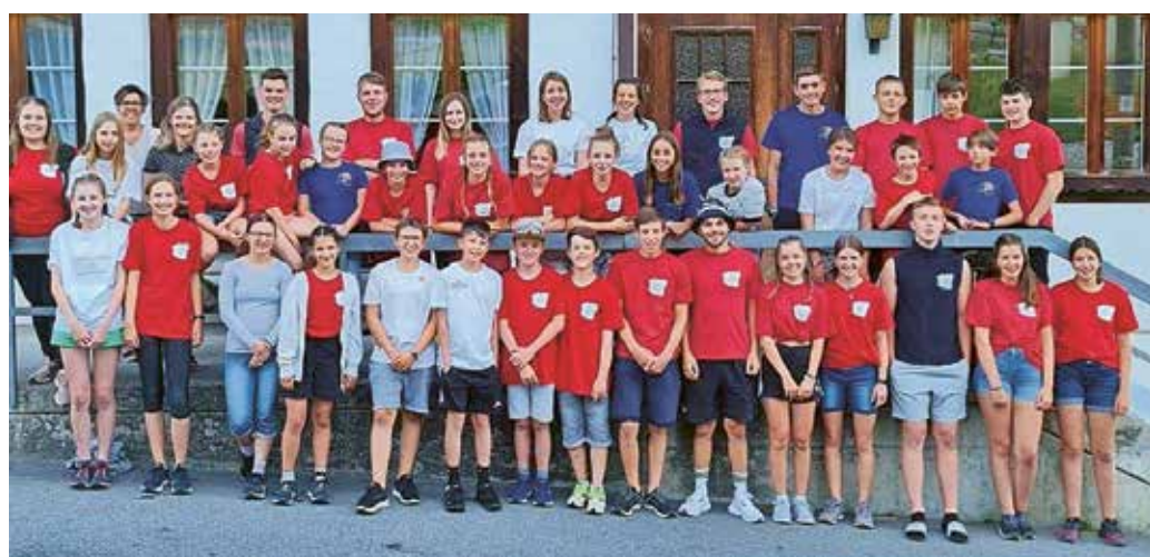
Ministrantenlager in Zweisimmen BE

Erntedankfest / Familiengottesdienst Sonntag, 18. September 10.30 Uhr