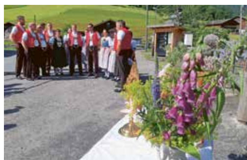
Impressionen vom Kirchenfest Patrozinium, Familiengottesdienst mit Fronleichnamprozession

Bitte beachten Sie auch die Daten im allgemeinen Teil auf Seite 2.