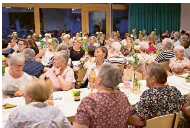
Jubiläumshauptversammlung 100 Jahre Frauen- Mütter-Gemeinschaft FMG