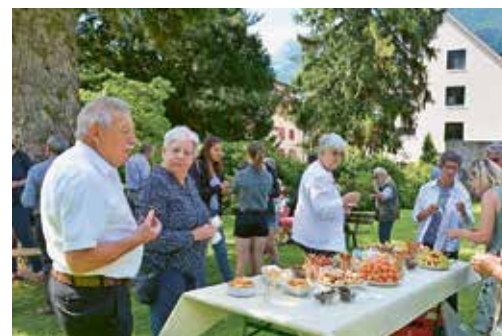
Kirchenfest St. Peter und Paul