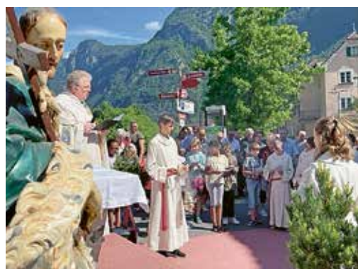
Bachprozession am Pfingstmontag mit dem heiligen Nepomuk.