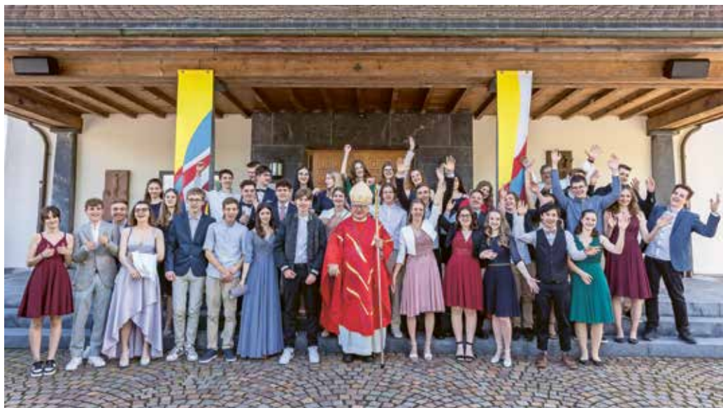
Firmung in Heiligkreuz (oben) und Wangs (unten)