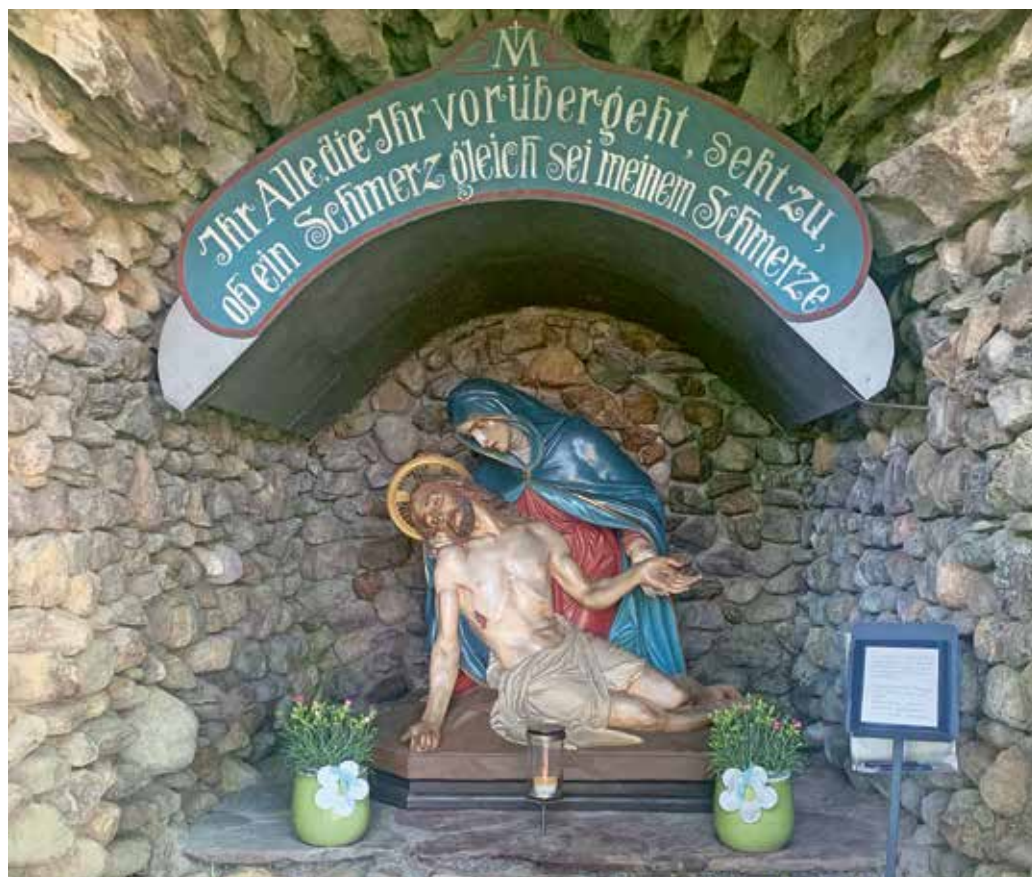
Grotte Wangs mit restaurierter Pietà