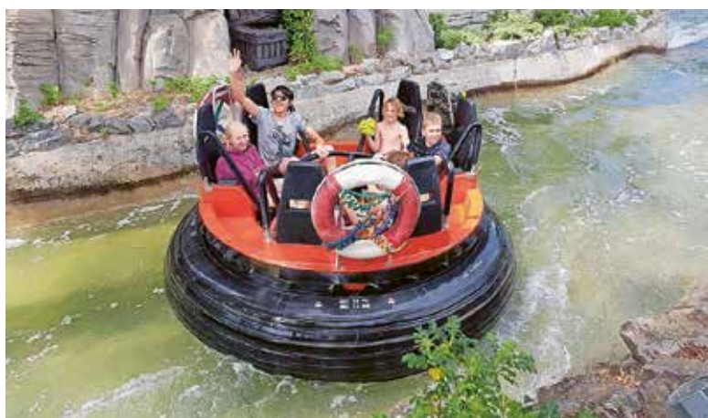
Ministrantenausflug in den Europapark am 21. Mai 2022