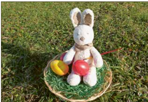
Der Osterweg – ein Erlebnis für Familien.

vom 10. April bis 24. April 2022 – diesmal rund um die Pfarrkirche Mels. Habt Ihr Lust zu einem kleinen gemeinsamen Spaziergang, um an verschiedenen Posten mit allen Sinnen die Ostergeschichte zu entdecken? Diesmal begleitet euch die kleine Franzi. Der Osterhase erzählt euch, was mit Jesus vor und an Ostern geschah. An jedem Posten gibt es auch für die Kleinsten etwas zu entdecken oder zu tun. Der kinderwagentaugliche Weg beginnt und endet an der Pfarrkirche Mels und kann vom 10. bis 24. April 2022 besucht werden. Alter unbegrenzt. Dauer: ca. ¾ bis 1 Stunde. Die Geschichte wird über eine kostenlose App erzählt. Dazu einfach die App vom Actionbound herunterladen. Unten stehenden QR-Code scannen und los geht's. Viel Freude!